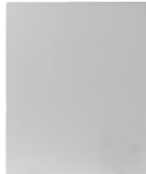
BASE-PAVIMENTO Base da pavimento H: 50cm