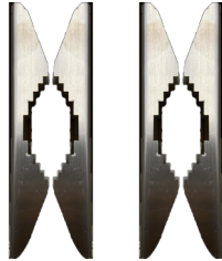
FIX-PALO Kit fissaggio a palo