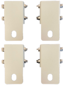
FIX-MURO Kit fissaggio a muro