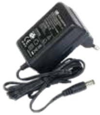
Alimentatore 24V 0,8A