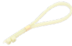
Fascette di fissaggio