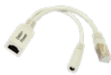
Iniettore di PoE