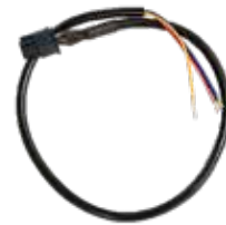
0.35m 4pin Automotive adapter cable