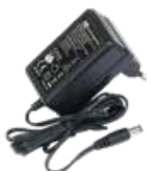
Alimentatore 24V 0,8A