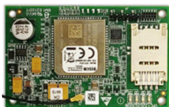
Modulo GSM nella Centrale RISCO

N.B PER OGNI IMPIANTO L'INSTALLATORE PUÒ DECIDERE SE ESSERNE RIVENDITORE O SOLO INSTALLATORE