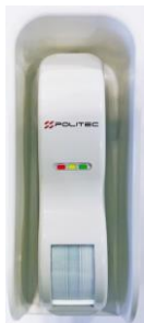
Staffa a «L» Inclusa

Sensore a tenda studiato per la protezione di varchi (porte e finestre) sia per uso esterno che per uso interno con grado di protezione IP65. Grazie alle sue ridotte dimensioni ad alto digital signal processing viene posizionato in qualunque tipo di installazione con estrema rapidità ed alta efficienza (Pet immunity a 10kg – Insect immunity – Pir limiter – Security mode). Il sensore è unico sul mercato internazionale in quanto presenta la microonda sempre attiva 24h/24. Ciò permette la rilevazione di una persona in corsa e non presenta alcun limite legato a tempi di standby. Nelle due versioni (Standard e FLAT), può alloggiare qualunque trasmettitore radio in commercio.