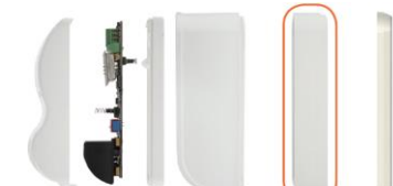
Trasmettitore universale inseribile